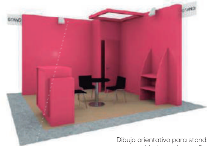
Dibujo orientativo para stands abiertos a dos pasillos

Superficie y stand abierto a pasillos (ver dibujo orientativo) / Paredes de aglomerado pintado formando un muro de 10 cm. 5 colores de pintura a elegir por el expositor entre los que se indican a continuación: Blanco, Verde, Negro, Granate, Naranja.