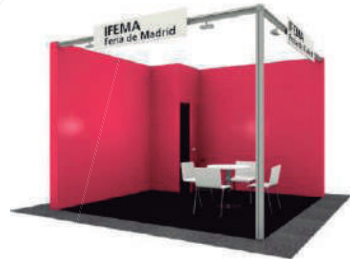
Dibujo orientativo para stands abiertos a dos pasillos

Superficie y stand abierto a pasillos (ver dibujo orientativo) / Paredes de aglomerado pintado en un color a elegir por el expositor entre los que se indican a continuación: Blanco, Verde, Negro, Granate, Naranja.